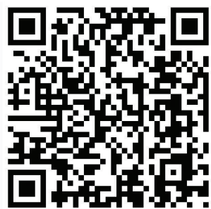
MI320 EJ TOUCH